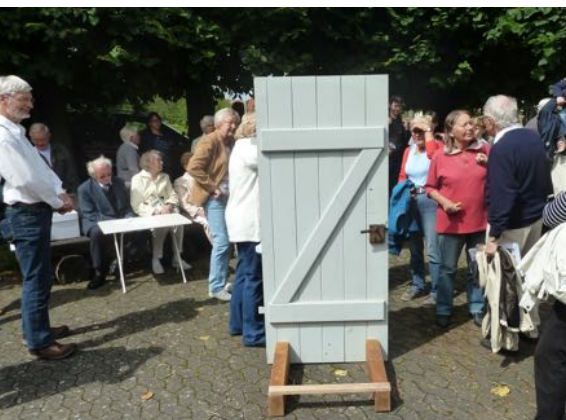
3. Tür - Reformation in der Gemeinde