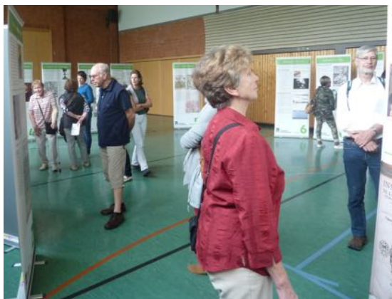
Ausstellung Durchblick Reformation