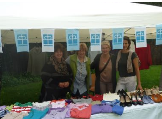
Info- und Verkaufstand des Diak. Werkes