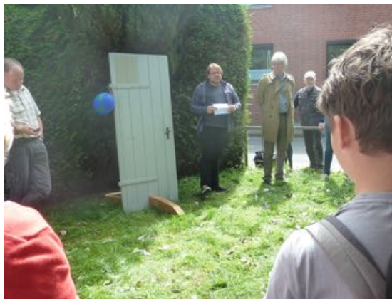
2. Tür: Einflüsse auf die Reformation mit Quiz