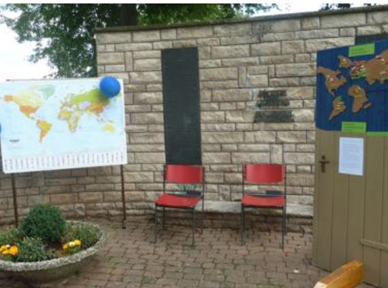
1. Tür: Wo finden wir ev./ref. Christen?